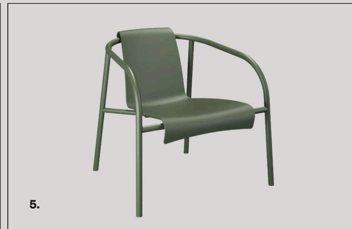
1. Silla Canalé Verde Claro – 2. Silla Canalé Azul – 3. Silla Canalé Azul Oscuro – 4. Silla Canalé Turquesa – 5. Sillón Recovery